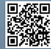
Вимоги до оформлення